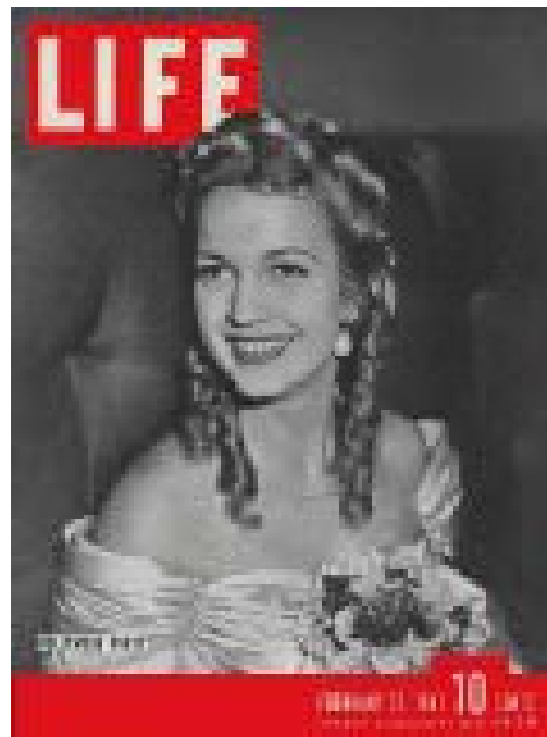
Cobina Wright Jr